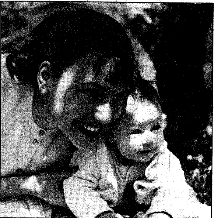
...pero su bella mamá no se conformaba