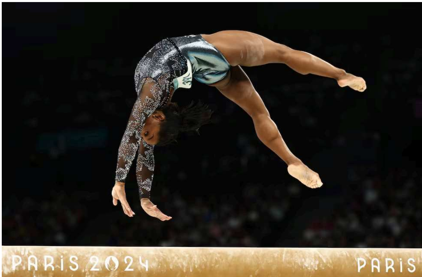
Biles en acción sobre la barra de equilibrio.